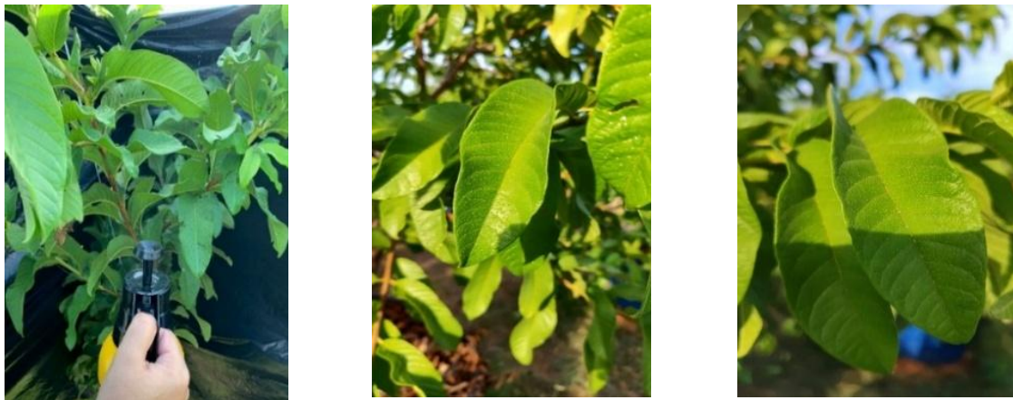
Figura 3. Pulverização foliar de ácido salicílico nas plantas de goiabeira cv. Paluma , com auxílio de pulverizador manual e lata plástica.

A adubação com nitrogênio, potássio e fósforo, foi feita de acordo com recomendação de Cavalcanti (2008). Para o preparo das concentrações de ácido salicílico foi feita a dissolução do ácido salicílico PA em 30% de álcool etílico e 70% de água destilada, conforme as concentrações de AS. A aplicação foliar foi iniciada aos 15 DAT (Dias após o transplante) e, posteriormente, a cada 15 dias, pulverizando-se as faces abaxial e adaxial das folhas, às 17:00 horas.