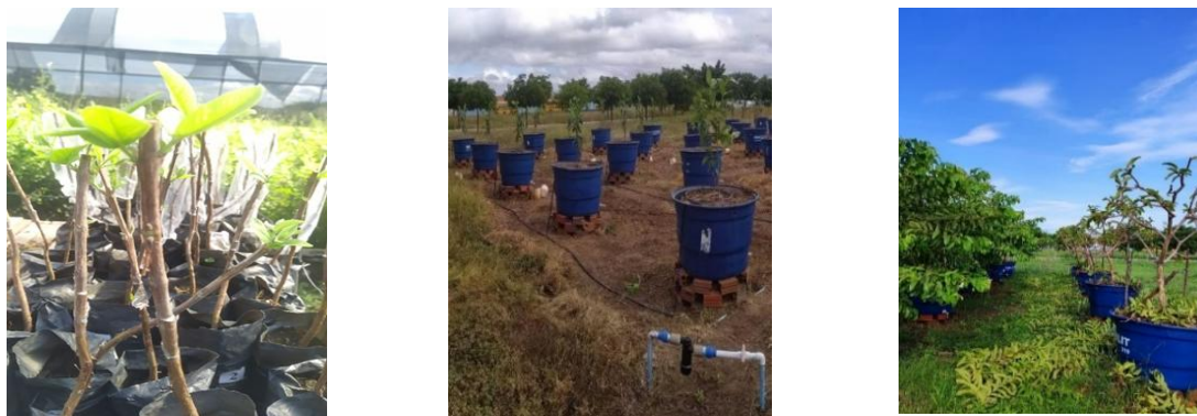
Figura 2. Produção de mudas de goiabeiras enxertadas em araçás poda de formação e de frutificação para cultivo com diferentes frequências de irrigação e aplicação exógena de ácido salicílico.

Nesta pesquisa, foram utilizadas mudas enxertadas sendo a cv. Paluma como enxerto (copa), onde, está é caracterizada por possuir frutos grandes após atingirem seu potencial produtivo (acima de 200 g em média). Para o porta-enxerto foi utilizado o araçazeiro amarelo ( P. cattleianum ), encontrado em quase todas as regiões se adaptando as diversas condições climáticas sendo de fácil acesso, também é caracterizado por ser uma opção de controle para nematóides. Sendo o transplântio realizado quando atingiram 50 cm de altura. A haste principal das plantas foi podada com 40 cm de altura. A partir das brotações que surgiram, foram selecionadas três pernas bem distribuídas, no sentido dos quatro pontos cardiais. Após atingirem seu amadurecimento, as pernas principais foram podadas, de modo a permanecerem com 30 cm de comprimento. A poda de frutificação foi feita aos 245 DAT deixando-se os ramos terciários com 20 cm (Figura 2).